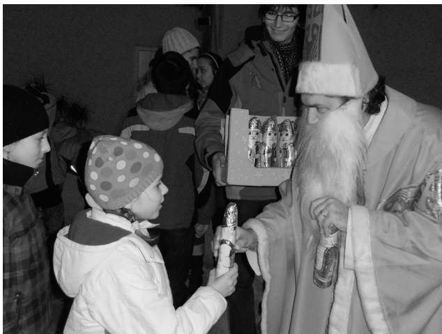
sviatok sv. Mikuláša v našej farnosti

Prosíme všetkých členov Centra, aby poplatky na druhý školský polrok uhradili v pracovnom čase v Centre do 15. januára.